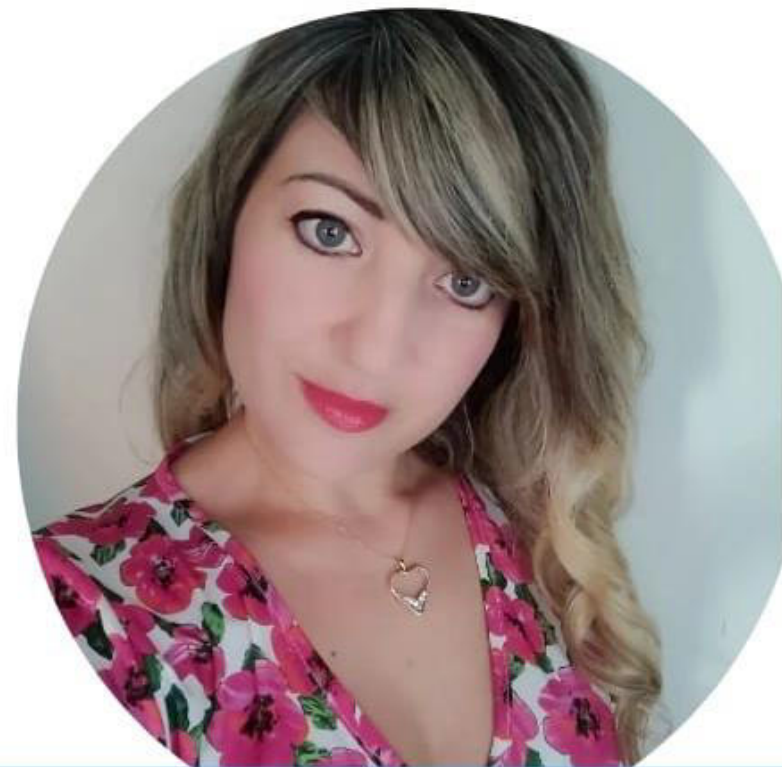
Vanessa Acri Scuola Primaria

Voglio una scuola ove integrazione e inclusione non siano solo belle parole sulla carta ma qualcosa di reale e concreto. Voglio che i docenti si sentano motivati nel loro lavoro perché adeguatamente riconosciuto nella sua dignità e adeguatamente remunerato. Voglio docenti con la voglia di portare i bambini in gita perché lo Stato gli riconosce la trasferta e li tutela giuridicamente. Voglio una scuola che abbia ambienti idonei all'apprendimento e con i giusti strumenti e non tanti fondi investiti male a causa dei troppi vincoli imposti. Insieme possiamo! Scegli NoiScuola Bene Comune.