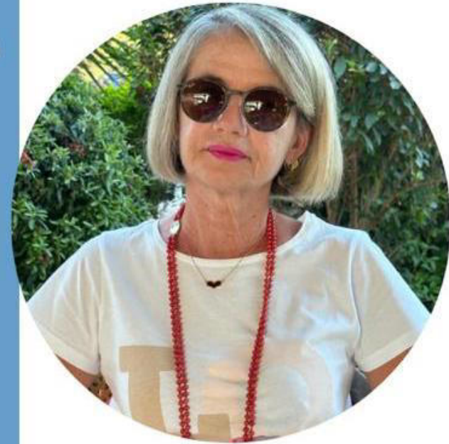
Michela Acconci Scuola Primaria

Ecco il perché della mia candidatura e la scelta di questo Sindacato che ha fatto proprie le lotte per una SCUOLA DEMOCRATICA, LIBERA che sappia dare dignità' alla professione degli insegnanti e che passi anche da una " giusta" riqualificazione economica.