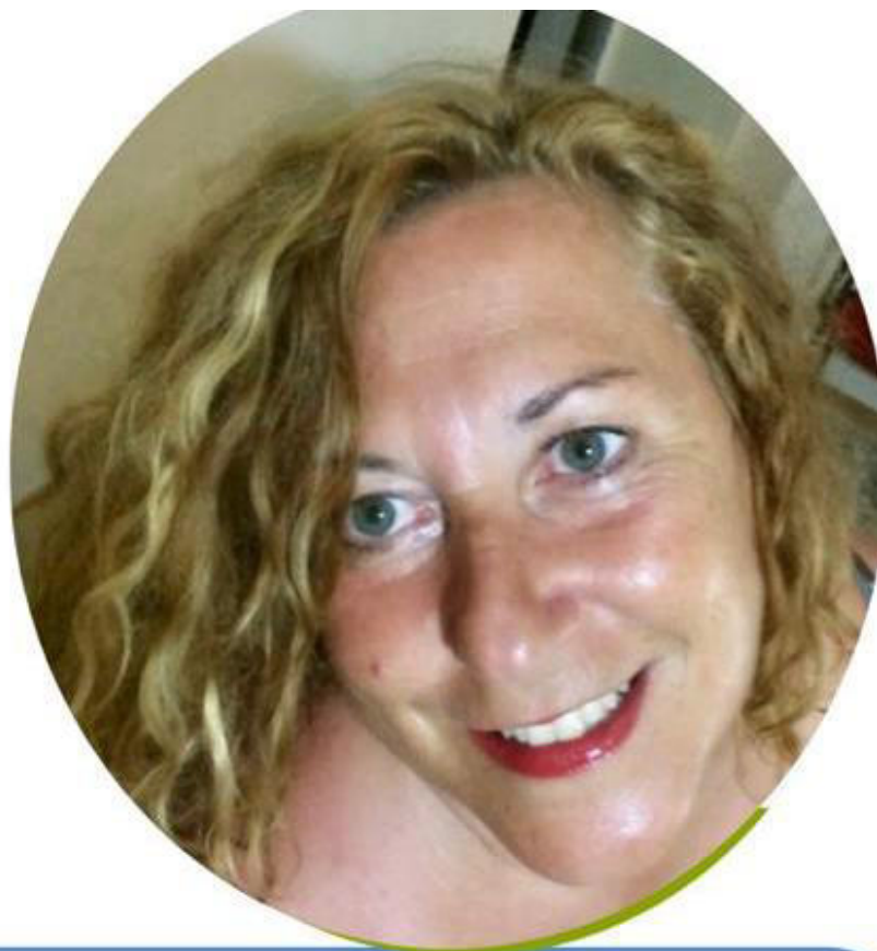
EMILIA MEZZATESTA SCUOLA PRIMARIA

Ho accettato di candidarmi in questa lista perché credo nelle cose umili, ho sempre lottato per il riscatto sociale e la dignità della persona, promuovendone la crescita personale e sociale. Conosco il mondo della scuola paritaria, della scuola pubblica e della cooperazione sociale. Ogni giorno della mia vita dal 1990 l'ho vissuto educando, empatizzando con alunni, colleghi, famiglie, associazioni. Ritengo che la nostra presenza nel mondo del sindacato dei "Grandi" possa fare la differenza. Se sei sfiduciato/a e non ti senti ascoltato/a sappi che tanti docenti sono nella tua stessa condizione. Fai un passo di fiducia, aiutaci a riappropriarci della dignità del ruolo, ormai perso nel tempo.