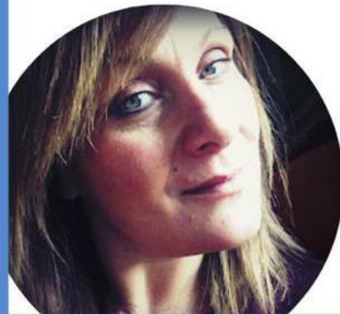
NADIA TAVELLA SCUOLA SECONDARIA DI PRIMO GRADO

Il nostro scopo come lista sarà quello di portare una fotografia attendibile della realtà, e rappresentare al meglio tutto il comparto scuola. Bisogna ridare dignità alla figura docente perché siamo i primi agenti di inclusione sociale ed educativa.